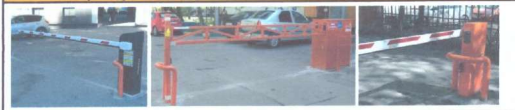
Фото 1 - ул. Дубровская 18 - шлагбаум Doorhan Barrier с защитой и Диспетчеризацией

Фото 2 - ул. Зеленодольская д.7 - Антивандальный шлагбаум сварной с защитой и Диспетчеризацией